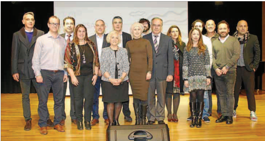
Directivos y colaboradores de la Fundación Respiralia, en el acto del décimo aniversario de la entidad celebrada anoche en el Ágora Portals.